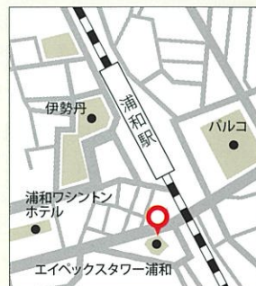
個別指導塾 ベストワン浦和校

〒さいたま市浦和区高砂1-2-1 エイペックスタワー浦和212 ☎048-711-3162